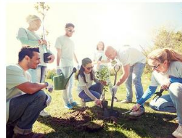
Klimainitiative München Ich mach' was

Zu „München klimaneutral“ beitragen. Teilprojekte: